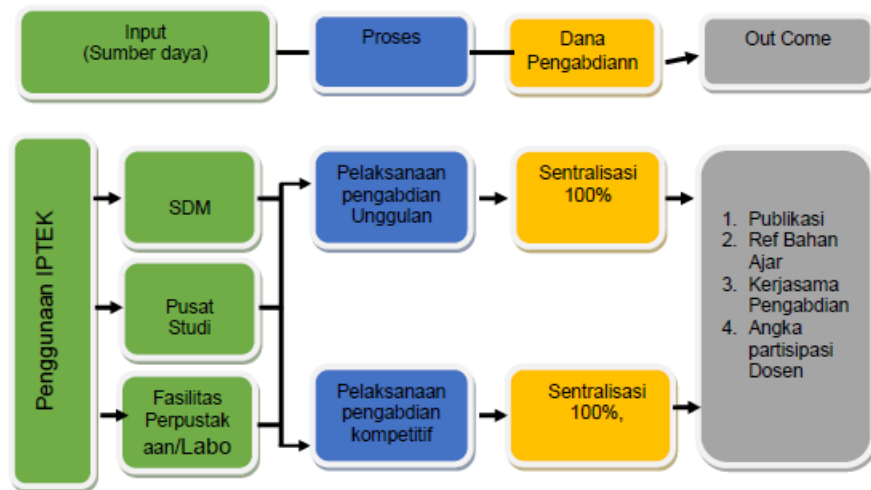
Gambar 3.1 Strategi pengelolaan pengabdian pada masyarakat

Rumusan rumusan yang tercantum dalam dokumen Renstra PPM ini diharapkan menjadi tidak kaku, meski tetap masih mempunyai arah yang jelas. Secara garis besar peta strategi implementasi Resntra PPM adalah pengelolaan sumber daya manusia pelaksana pengabdian kepada masyarakat, agenda pengabdian, sumber dana dan outcome disajikan pada gambar di bawah ini.